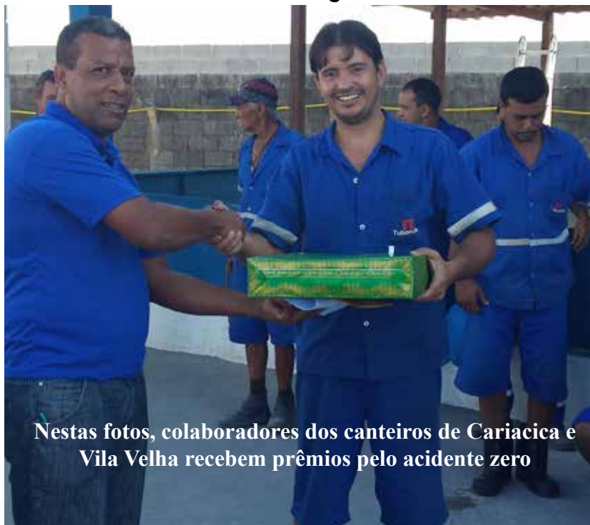
Nestas fotos, colaboradores dos canteiros de Cariacica e Vila Velha recebem prêmios pelo acidente zero