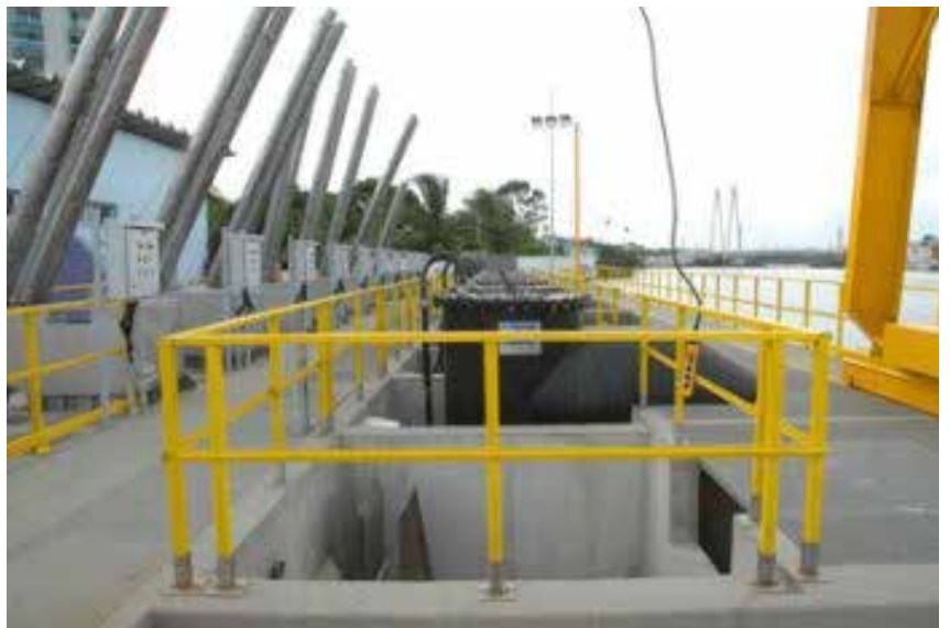
A Estação de Bombeamento de Águas Pluviais Doutor Antônio Ferreira da Silva Pinto, no bairro de Santa Luzia, tem capacidade de lançar 39 mil metros cúbicos de águas de chuvas por segundo, no Canal de Camburi